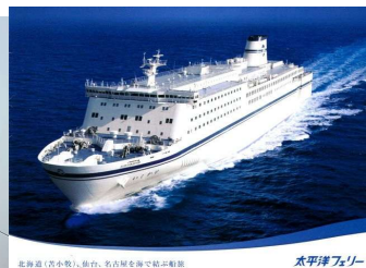
【太平洋フェリー B寝台】