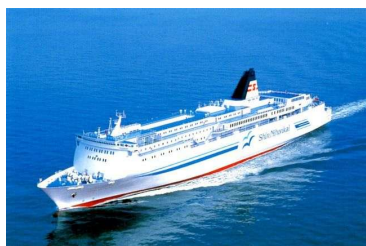
【新日本海フェリー ツーリストA】