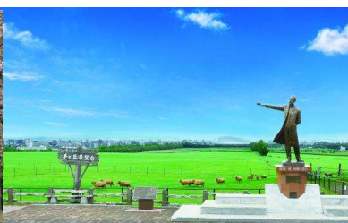
【さっぽろ羊ヶ丘展望台】