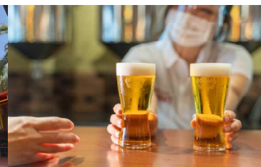
【オリオンハッピーパーク】