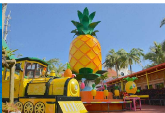
【ナゴパイナップルパーク】