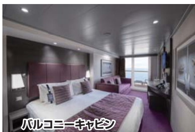
バルコニーキャビン

全長:315,83m 総トン数:171,598トン 最大乗客数:5,686人 乗務員の数:約1,560人 部屋数:2,217室 レストラン12ヶ所 プール4ヶ所 大劇場・プロムナード