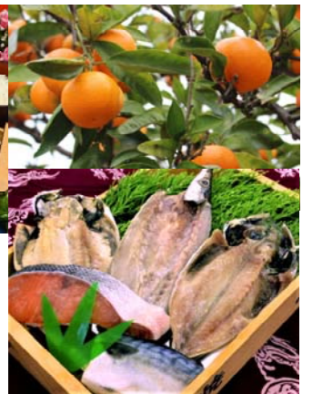
【島田ばらの丘公園】