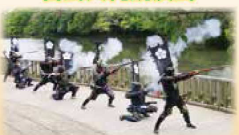
とせ 12:45~ 亀岡市役所 ところ 15:40~ 南郷公園ジャチホコ広場