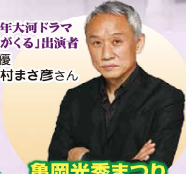
2020年大河ドラマ「麒麟がくる」出演者 俳優 西村まさ彦さん 亀岡光秀まつりスペシャルゲスト