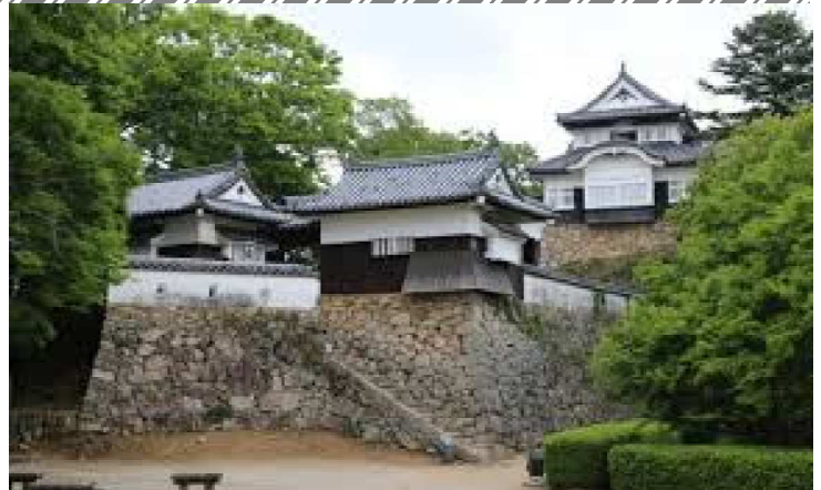
【天空の城 備中松山城】