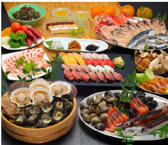
【浜焼き&寿司食べ放題昼食】

① 7:30 安曇野IC == 7:45 合同庁舎 == 8:00 塩尻北IC == 8:10 みどり湖PA == 8:15 岡谷IC == 8:30 諏訪IC == (途中休憩: 15分2回) == 12:00頃 スタジアム希望者降車 == 12:20頃 エスパルスドリームプラザ・サッカーショップ等買物・自由昼食・徒歩・次郎長生家・徒歩 14:40頃 15:00頃 キックオフ18:00頃 ~ 20:20頃出発 == IAIスタジアム日本平 清水エスパルス VS 松本山雅FC == ホテル (希望者で懇親会) ② 8:45頃 朝食・ホテル == 9:00頃 家康が晩年を過ごした駿府城址 == 10:00頃 三島大社参拝 == 11:10頃 ~ 11:50頃 千鳥会館・浜焼きとお寿司食べ放題昼食 == 12:20頃 ~ 13:30頃 13:40頃 ~ 14:20頃 富士山をバックに駿河湾クルーズ == 14:45頃 ~ 15:45頃 沼津港・新鮮な魚介類のお買い物 == 諏訪地方地区(20:30頃) = 安曇野(21:30頃)