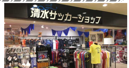
【エスパルスドリームプラザ】