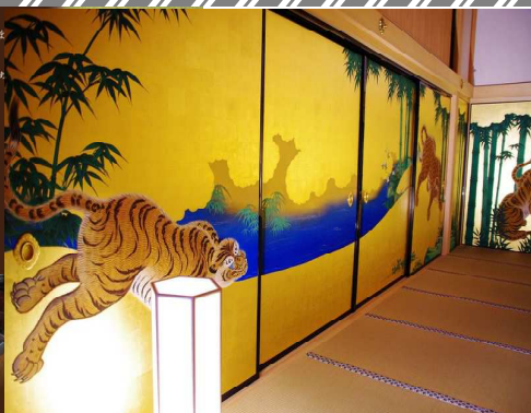
【名古屋城・本丸御殿】